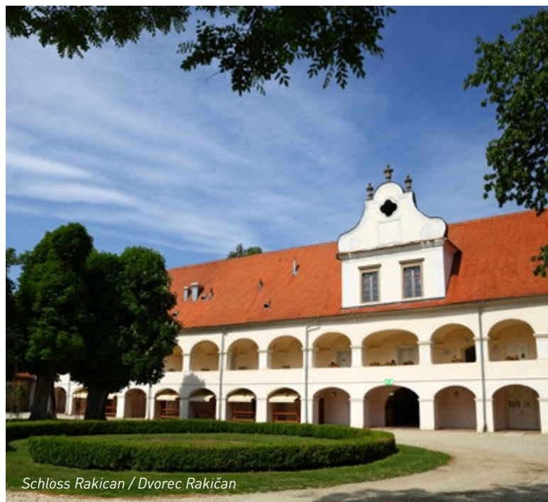
Schloss Rakičan / Dvorec Rakičan

RIS Dvorec Rakičan Lendavska ulica 28, Rakičan SI-9000 Murska Sobota +386 (0)2 535 18 96 info@ris-dr.si oder booking@ris-dr.si www.ris-dr.si