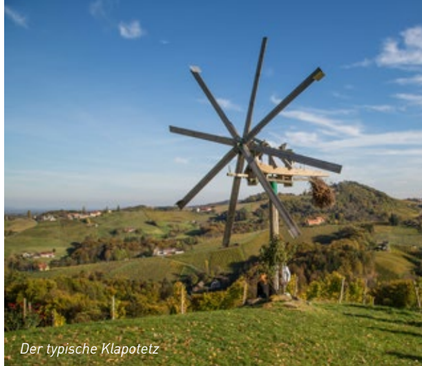
Der typische Klapotetz